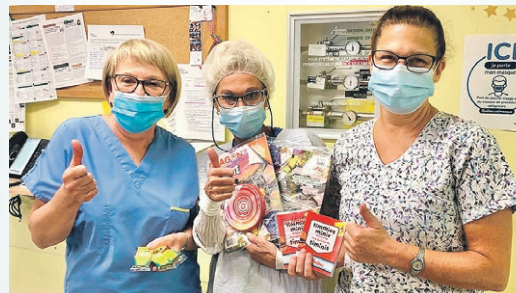
Membres du personnel de l'équipe d'ORL de l'Hôpital Sainte-Croix.

Jouets, coussins vibrants, trousse « Jouez à l'hôpital »