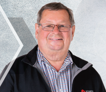
M. André Lemaire Habitations André Lemaire

Évènement signé FONDATION SAINTE-CROIX/HERIOT ici pour toute la vie!