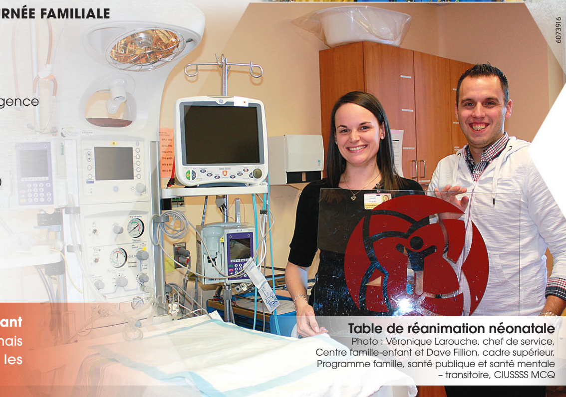
Table de réanimation néonatale

Avec la construction prochaine du Centre famille-enfant Girardin , la Journée familiale est plus essentielle que jamais pour bien équiper cette nouvelle installation pour les familles.