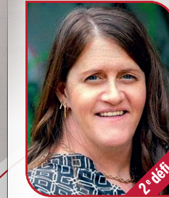
France Ponton 2 e défi