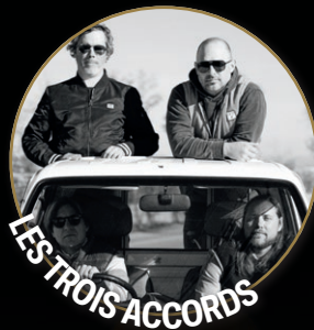
LES TROIS ACCORDS

DES ARTISTES D'ICI MOBILISÉS pour le nouvel hôpital!